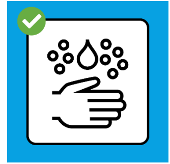
Se laver les mains