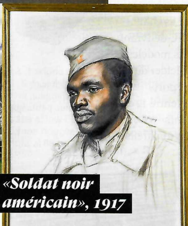
«Soldat noir américain», 1917