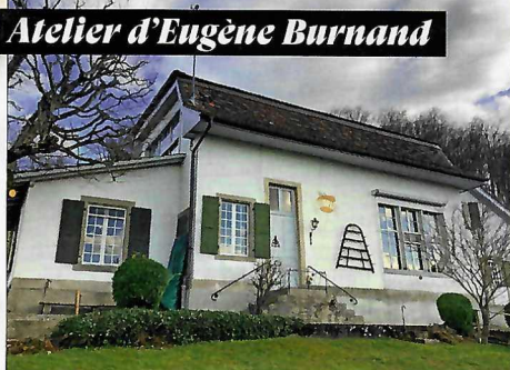
Atelier d'Eugène Burnand