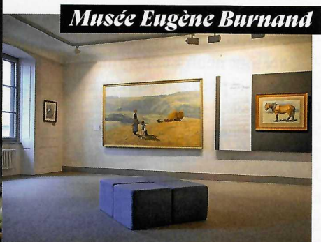
Musée Eugène Burnand